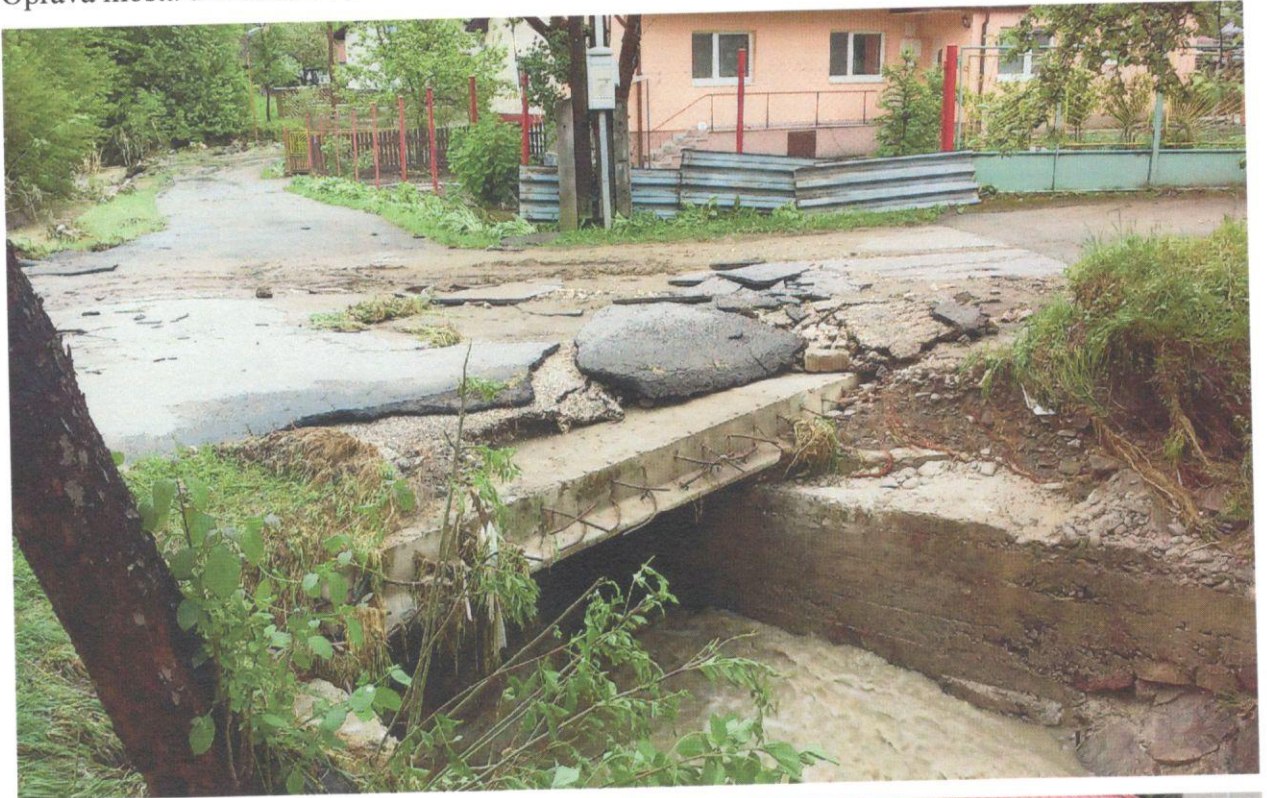
Oprava mosta u Richtárov :