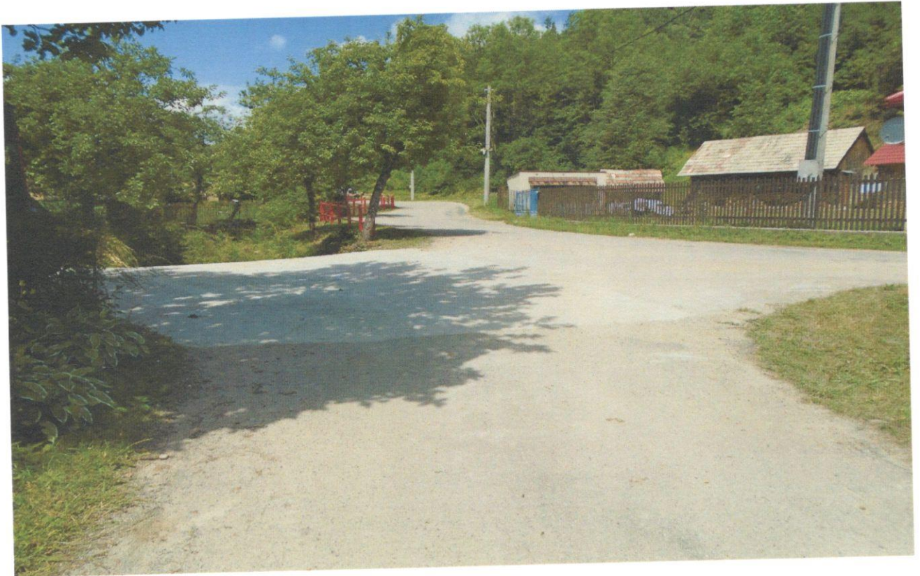
Vybudovanie odvodňovacieho kanála so šachtou: